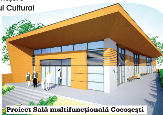
Proiect Sală multifuncțională Cocoșești